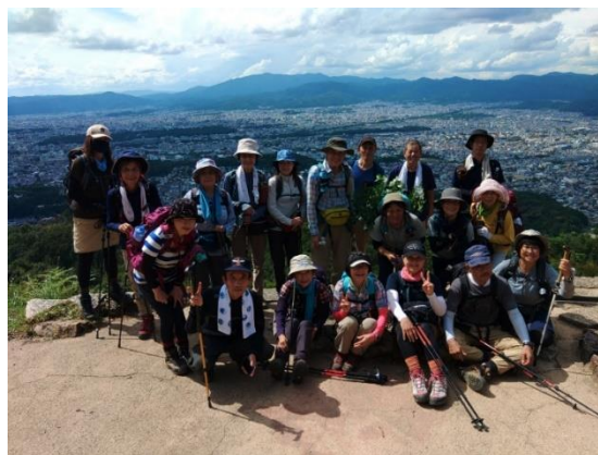
大文字火床の中心で