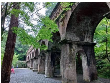
サスペンスドラマ舞台地 南禅寺 水路閣